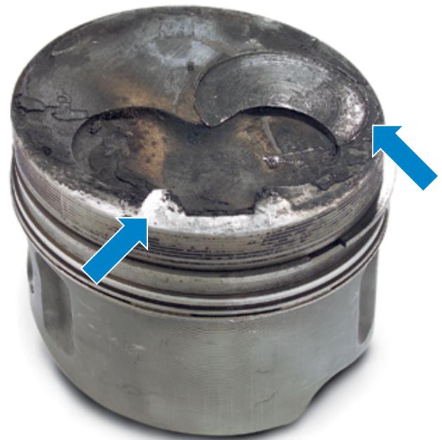
Fig. 4 Sinais de colisão devido ao superaquecimento no motor